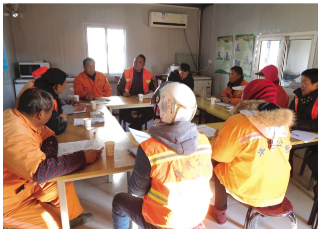
为深入做好党的“十九大”精神宣贯工作,华茂裕祥养护公司党支部开展班组集体轮训宣讲活动,组织职工研读学习十九大文件,引领职工将思想和行动统一到冲刺全年各项任务工作中来,用切实行动和良好业绩不断展示学习成果。(范晓宝)

鸣分别就学习党的十九大精神作了交流发言,一致认为党的十九大是一次举旗定向、引领复兴的大会,是一次凝心聚力、强党兴国的盛会。一致感到习近平新时代中国特色社会主义思想开辟了马克思主义新境界,为全面建设社会主义现代化国家、实现中华民族伟大复兴提供了科学指引和思想武器。一致表示要高举习近平新时代中国特色社会主义思想伟大旗帜,进一步强化政治意识,始终坚定理想信念,牢牢把握新时代的“根”和“魂”,保持一心一意干事创业的精神状态、增强勇于负责的工作魄力、强化创新发展进取的进取意识,全面贯彻、全面落实党的十九大各项决策部署,为建设富强美丽的新工投不懈努力。(工宣)