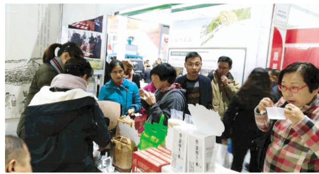
日前,青口投资公司“盐田玉”大米在2017第十二届上海优质大米及精品杂粮展览会上荣获特等奖,这是继荣获“江苏好大米”称号之后的又一殊荣。该展览会是全国的一个行业品牌展会,参加此次展会的有来自不同国家和地区的五百多家企业。(田盛楠)