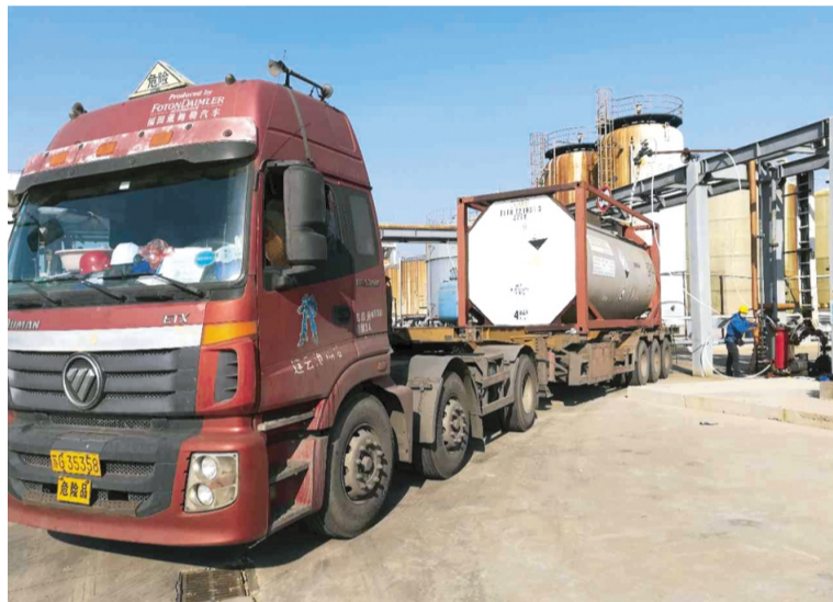
12月7日,利海化工公司顺利完成100吨氯化钾产品出口任务,标志着公司产品首次成功打开国际市场。图为仓储中心员工正在灌装氯化钾产品。